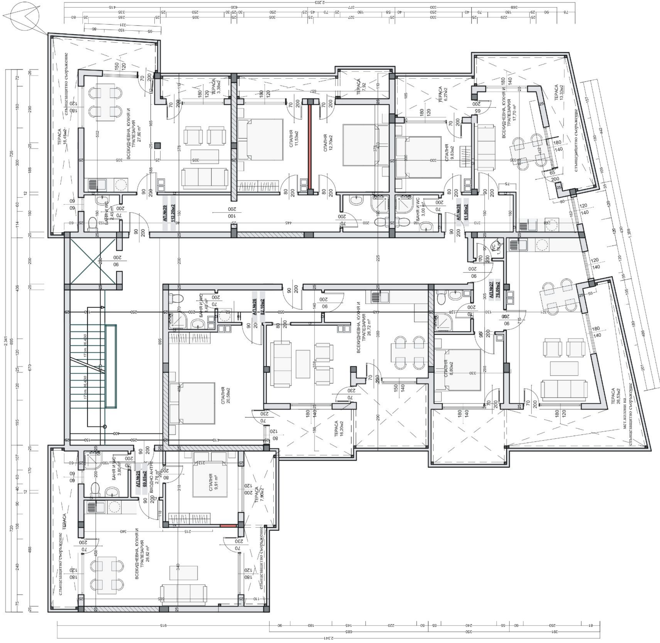
РАЗПРЕДЕЛЕНИЕ КОТА +14,10