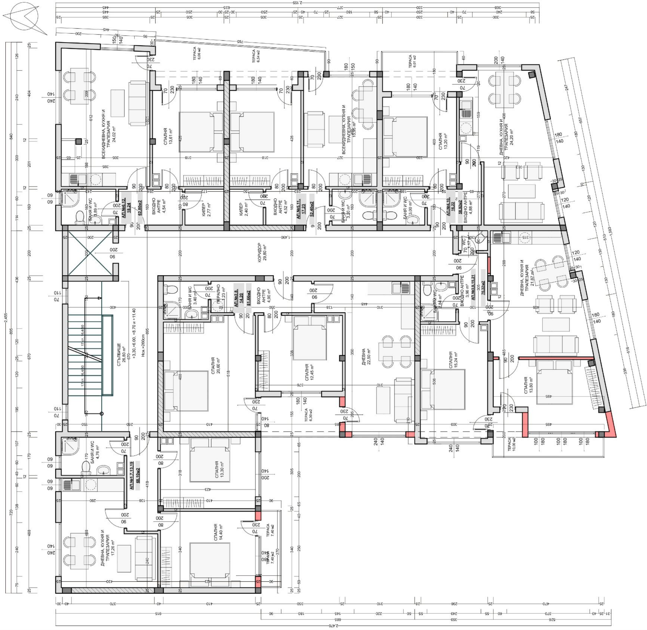
РАЗПРЕДЕЛЕНИЕ КОТА + 3.30,