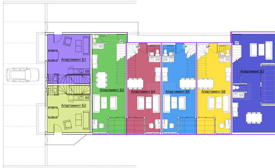
Схема ниво 5.60 мезонети секция Б